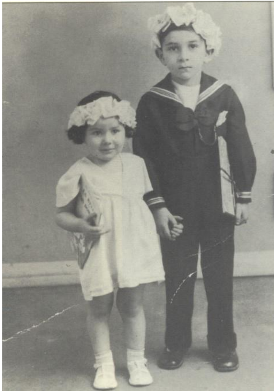
Lisette et Henry source photo : A memorial. Serge Klarsfeld crédit photo : D.R.